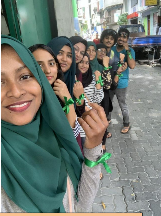
پروگرام کے اختتام پر سٹیوڈنٹس اور اسٹاف کے ساتھ سٹیوڈنٹس کی ایک گروپ فوٹو.