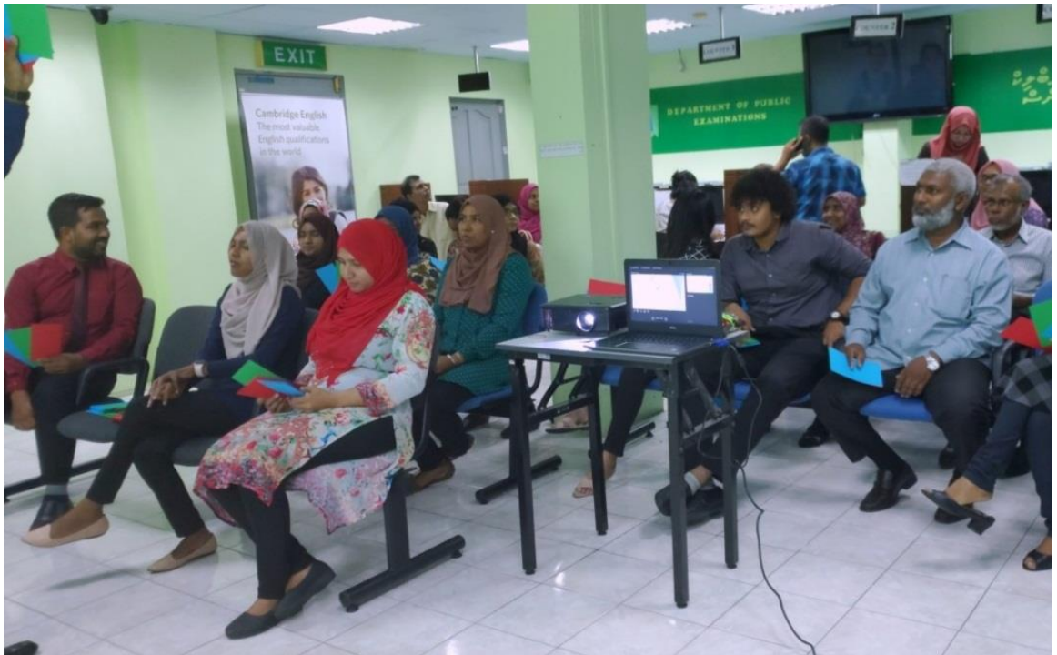
سٹیوڈنٹس کی ایک گروپ فوٹو 2 ویں سیشن